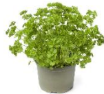
Petersilie im Topf 3,49 € / 1 Topf