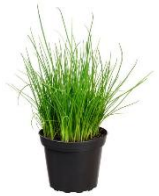
Schnittlauch im Topf 3,49 € / 1 Topf