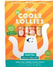
Cooler Lollies, Bunter Mix 2,99 € / 100 g