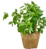
Basilikum im Topf 9,99 € / 0,5 l