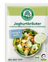
Joghurt Kräutermischung 1,59 € / 3 x 5 g