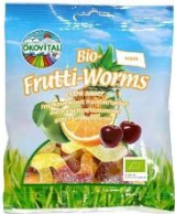
Frutti Worms ohne Gelatine 1,69 € / 80 g