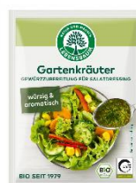
Garten Kräutermischung 1,59 € / 3 x 5 g