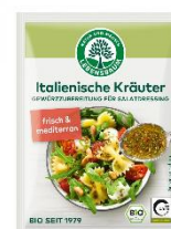
Italienische Kräutermischung 1,59 € / 3 x 5 g