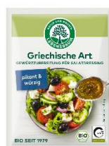
Salatdressing Griechische 1,49 € / 15 g