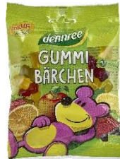
Gummibärchen vegan 1,49 € / 100 g