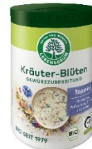
Kräuter-Blüten 4,49 € / 25 g